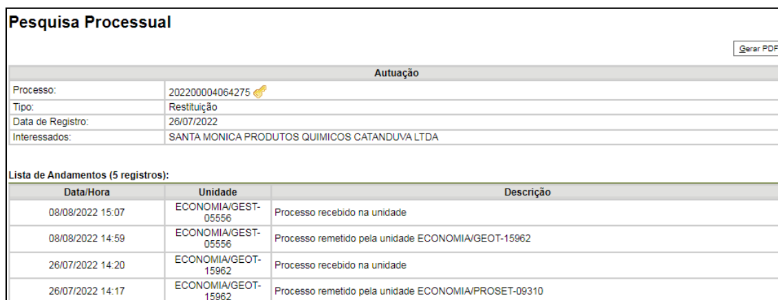
Figura 16 – Visualização do resultado da busca pelo processo

Ademais, na Plataforma do YouTube do Instituto Federal de Sergipe ( https://www.youtube.com/@IFSergipe ) está disponível o curso de Capacitação do Módulo Consulta Pública ofertado pela comissão de implantação do software. Nesta plataforma também é possível visualizar vídeos cursos com orientação de como realizar a pesquisa no módulo pesquisa pública, a exemplo do elaborado pelo Canal Colaborativismo disponível no link: https://www.youtube.com/watch?v=vO-NCBvYrNs .